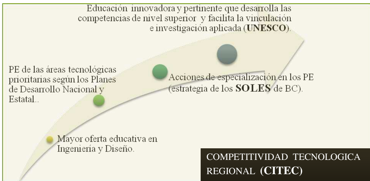
Figura 2. Avitia Patricia, 2011. Archivos Personales