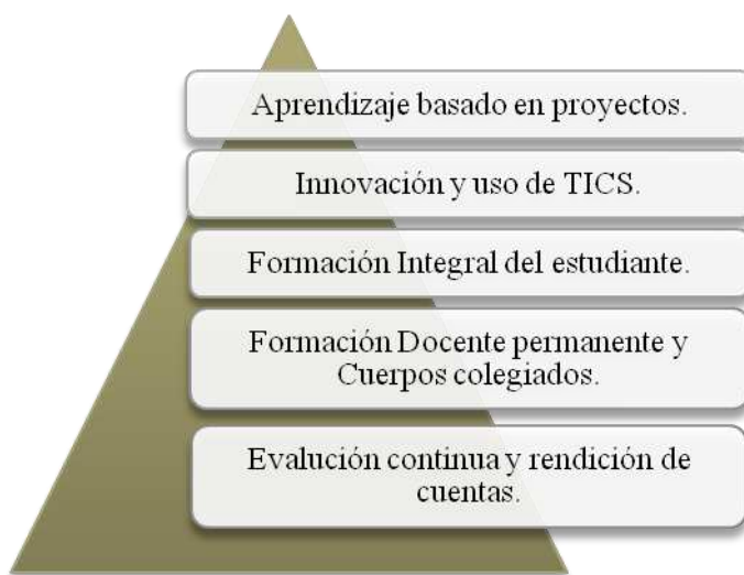
Figura 3. Avitia Patricia, 2011. Archivos Personales